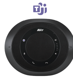
Microsoft Teams edition